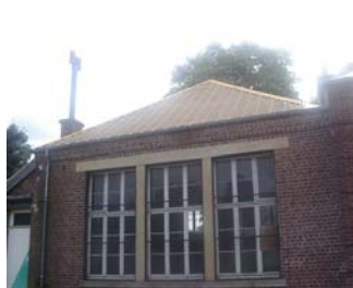
Toit local du Football