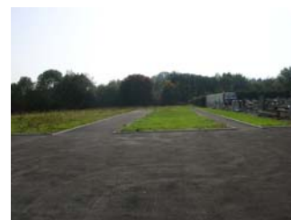
Création de deux allées au cimetière