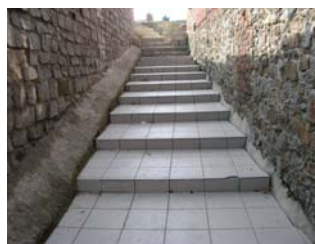
Escalier ruelle du Monument