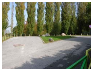
Parking école L. Liémans