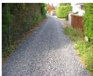
Rectification du sentier rue d'Hautmont