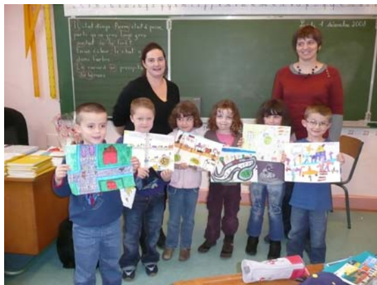
Quelques-uns des nombreux enfants récompensés