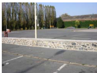
Mur Place du 8 Mai