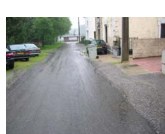
Ensemble Henri Barbusse