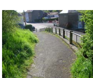
Chemin piétonnier rue de la Grimpette